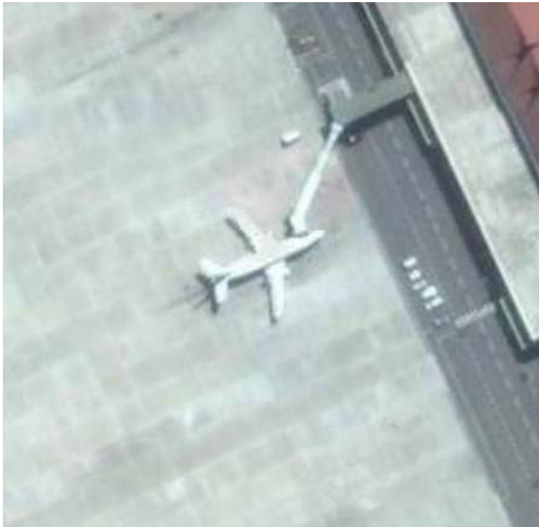
Gambar 3. Sebuah pesawat dalam rekaman Citra QuickBird