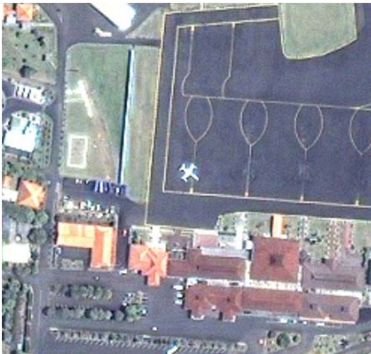
Gambar 2. Sebuah pesawat dalam rekaman Citra Ikonos.

Diluncurkan pada tanggal 18 Oktober 2001 oleh Digital Globe, merupakan citra satelit dengan resolusi tertinggi saat ini, yaitu 0.61 meter. Satelit ini mengorbit bumi sinkron dengan matahari setinggi 450 km. Waktu revolusinya adalah 93.4 menit. Resolusi spasialnya adalah 3-7 hari. Harga citra Ikonos adalah 24 USD/Km 2 .